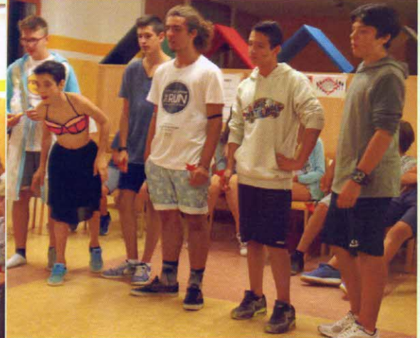
e stile "fuori di cico"