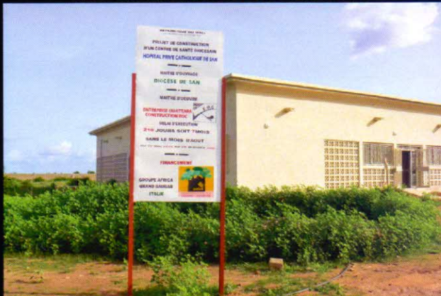
il Centro di maternità ultimato