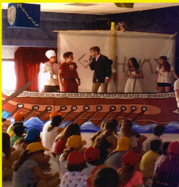
GREST: sulla nave di Ulisse verso Itaca -

la settimana in MONTAGNA (Segonzano TN), infine il gruppo dei giovani che vola in MALI . Però, che ricchezza di proposte !!! Un Oratorio che non va mai in ferie o meglio che vede nelle ferie un periodo di grandi esperienze. Complimenti ! Allora occhio alle foto (delle prossime pagine e riempiatevi il cuore)