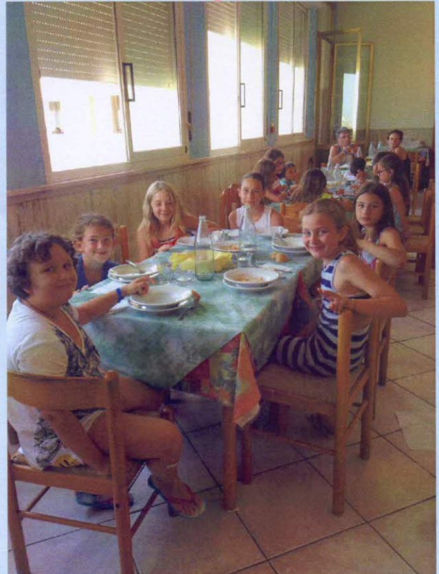
tutti a tavola: che fame ragazzi !