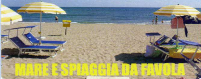
MARE E SPIAGGIA DA FAVOLA