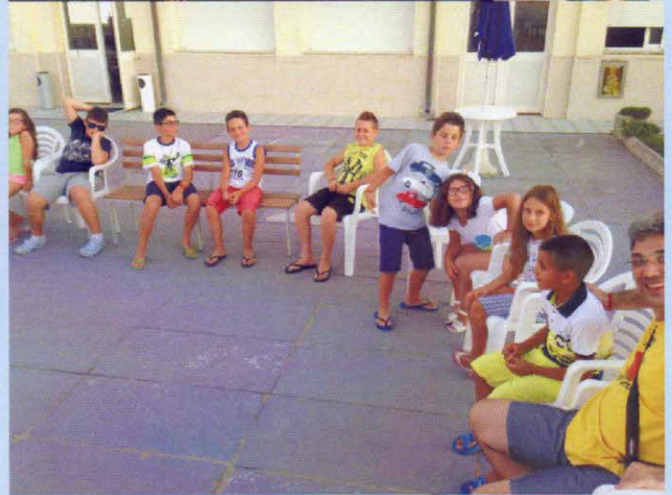
tutti in cerchio: che chiacchierate ragazzi !