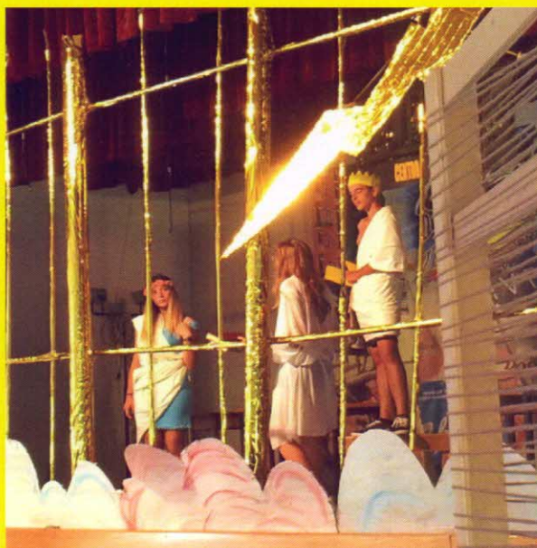
sul Centro benessere Olympus tra dei e dee