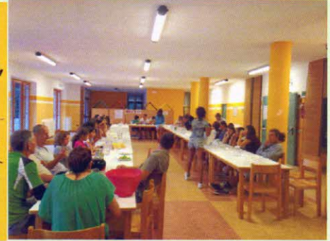
il lupo perde il pelo... il gusto ci guadagna