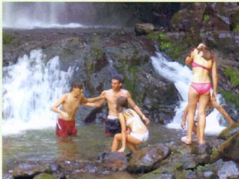
e poi il fresco ti temprà