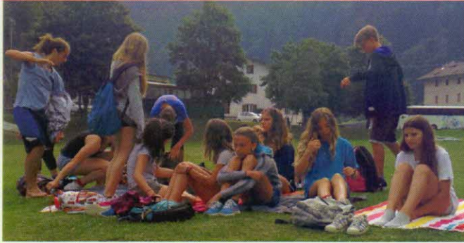
su prati e sentieri di montagna