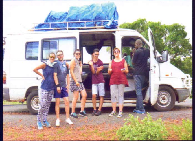
il lussuoso mezzo di trasporto