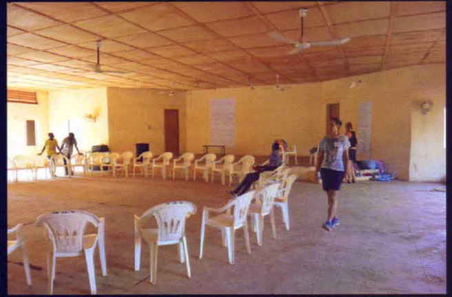
il salone del Centro giovanile