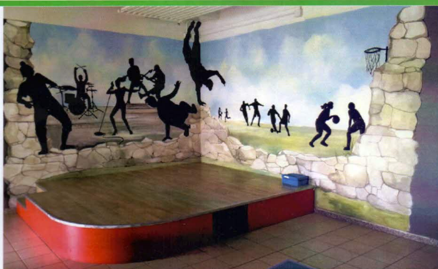
(sopra) fondale palco interno