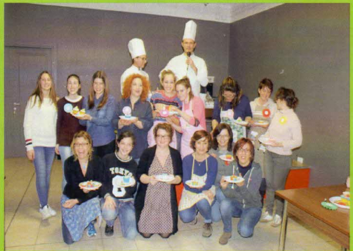
gruppo grandi pasticceri