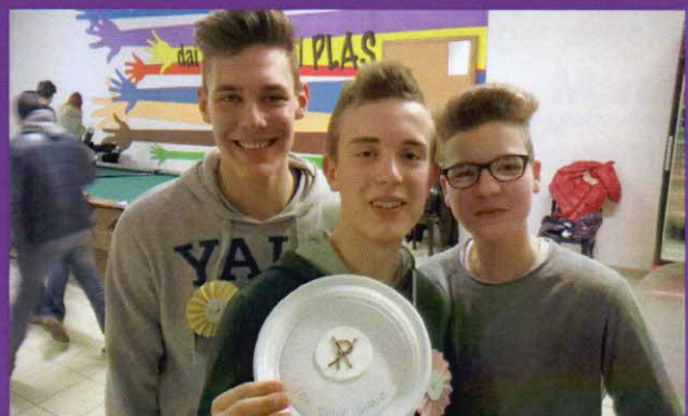
il dolce più dolce