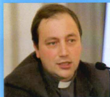
che sia lui il Lupo ?!

Alcuni rappresentanti dei 4 oratori di Ome Pade Rode Saia ogni tanto si ritrovano per confrontarsi a proposito delle iniziative degli oratori e in modo particolare ci sta a cuore come individuare un modo per entrare in contatto con la realtà giovanile delle nostre comunità che sembra un poco irraggiungibile.