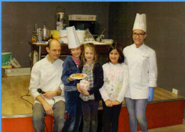
piccoli pasticceri vincitori