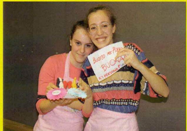
vincitori grandi pasticceri