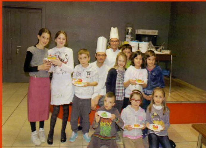
gruppo piccoli pasticceri

Una serata che fa parte del progetto DI QUALITÀ + che sta animando l'anno del nostro oratorio. Complimenti a tutti organizzatori e partecipanti