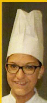
i due pasticcioni