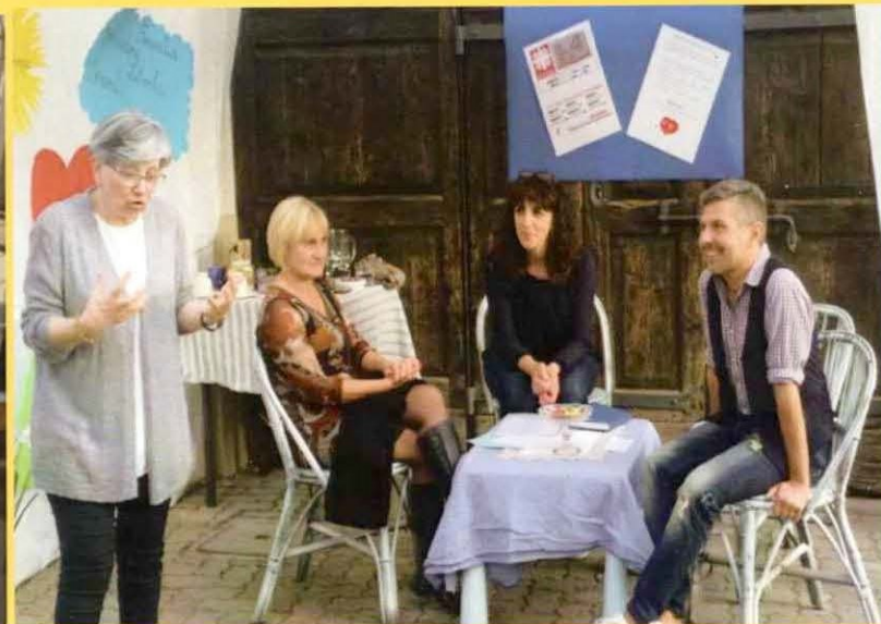
Questo è lo stand dove è stato mostrato come funziona il Centro di Ascolto Caritas