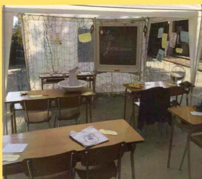
Questo è lo stand che rappresentava la formazione per diventare operatore Caritas